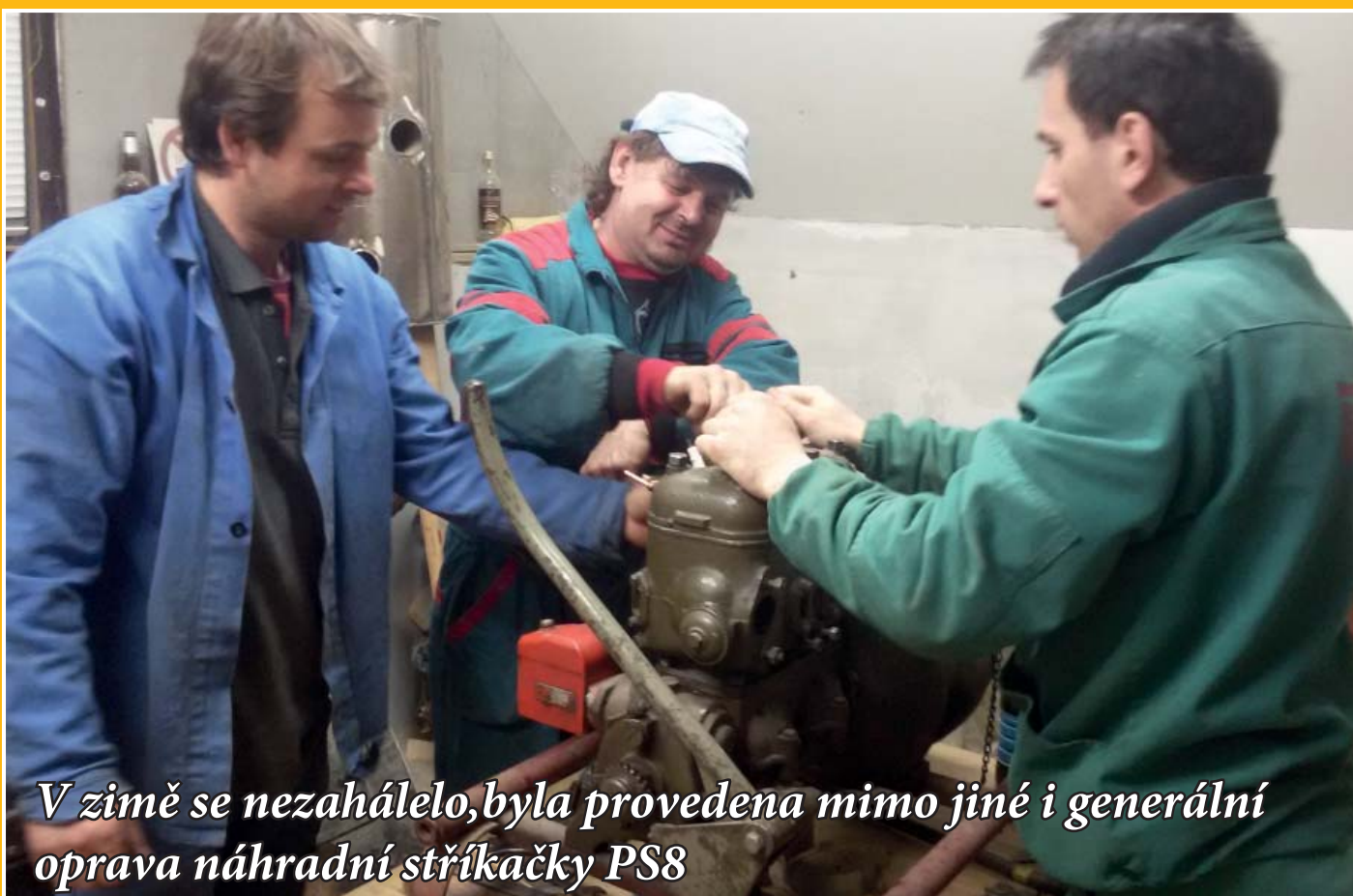
V zimě se nezhálelo, byla provedena mimo jiné i generální oprava náhradní stříkačky PS8

Vydává: Obec Leskovec, Leskovec 67, 756 11, IČO 00303984 www.leskovec.cz