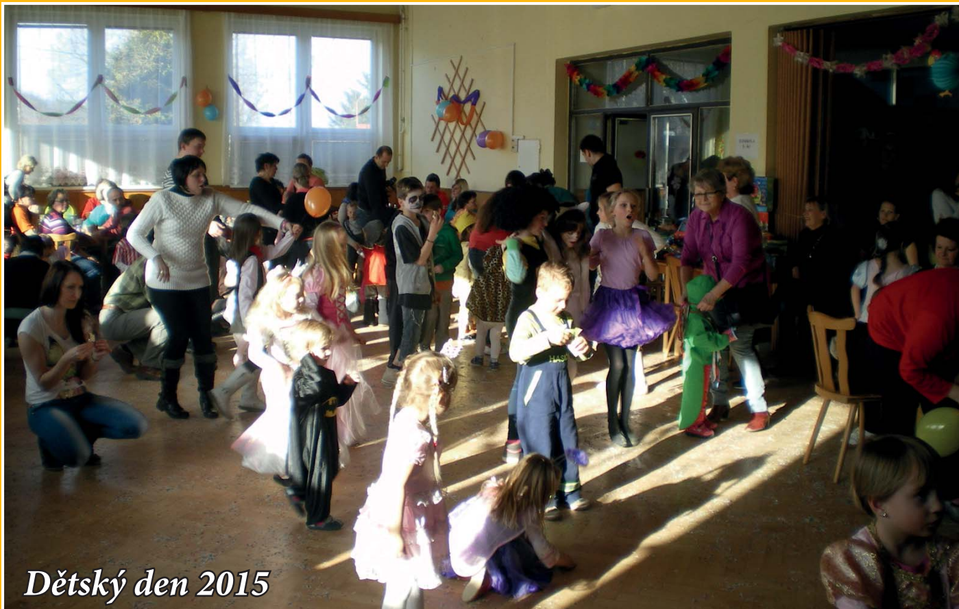
Dětský den 2015