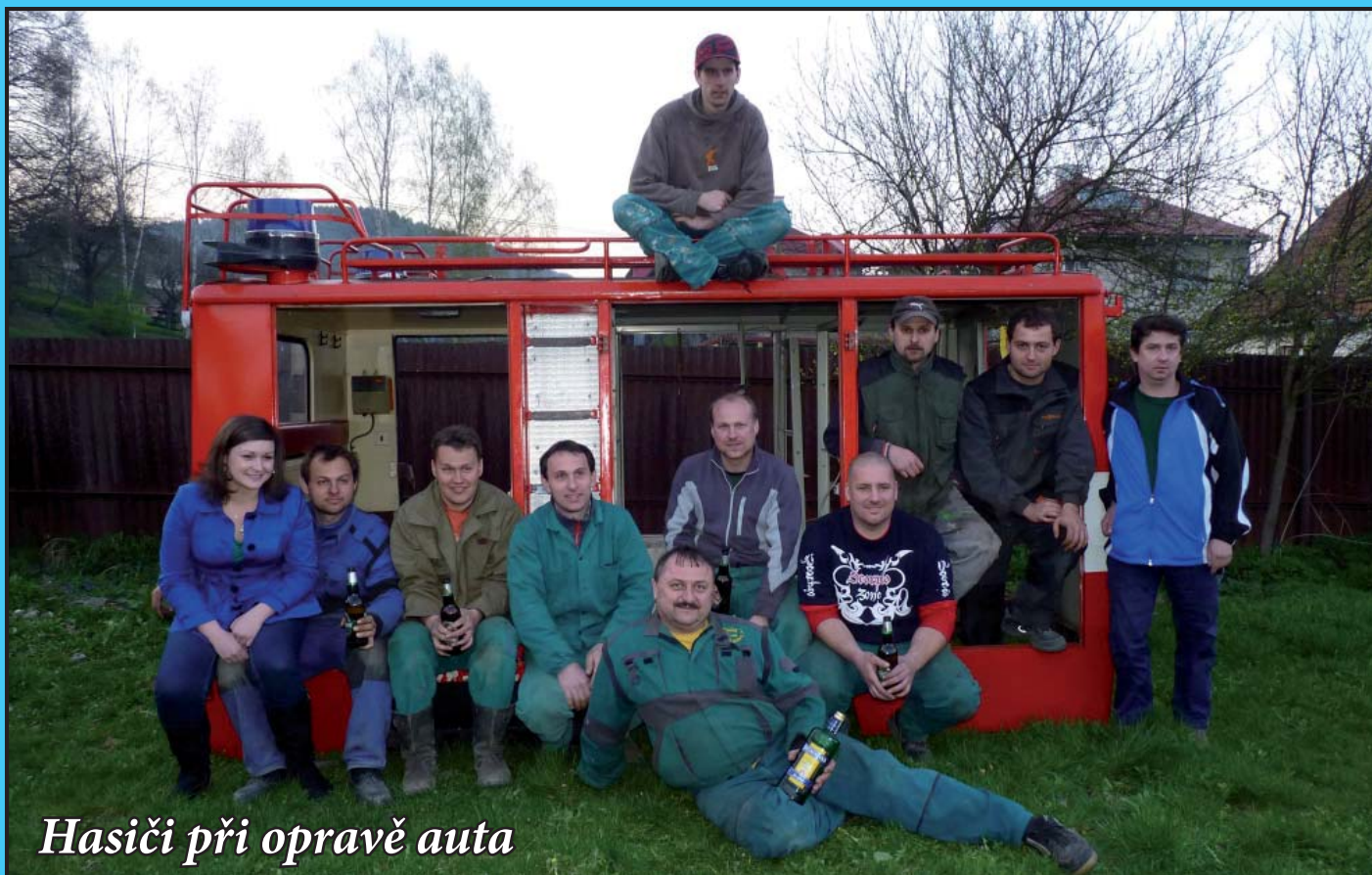
Hasiči při opravě auta