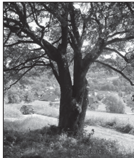
Klenec u vodojemu je památný strom a ten má zvláštní stupeň ochrany.