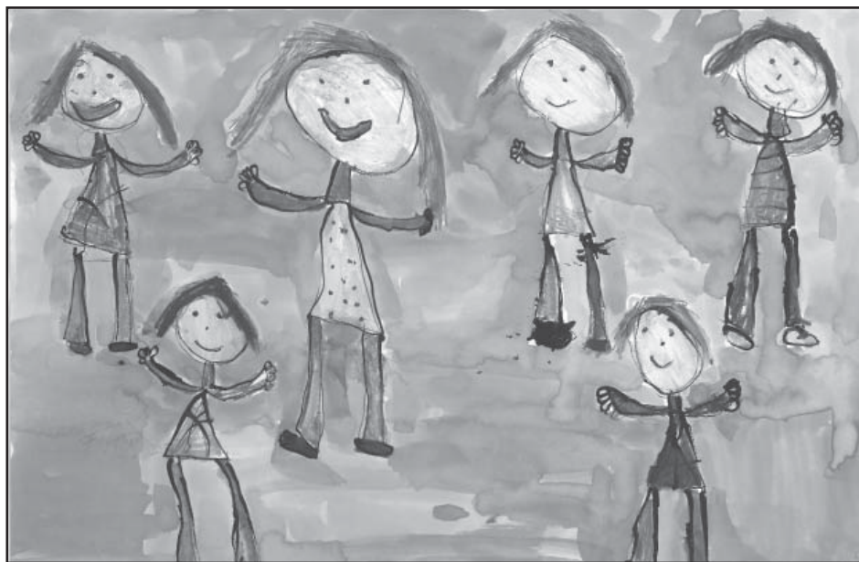
Hurá prázdniny, obrázek dětí ZŠ Leskovec