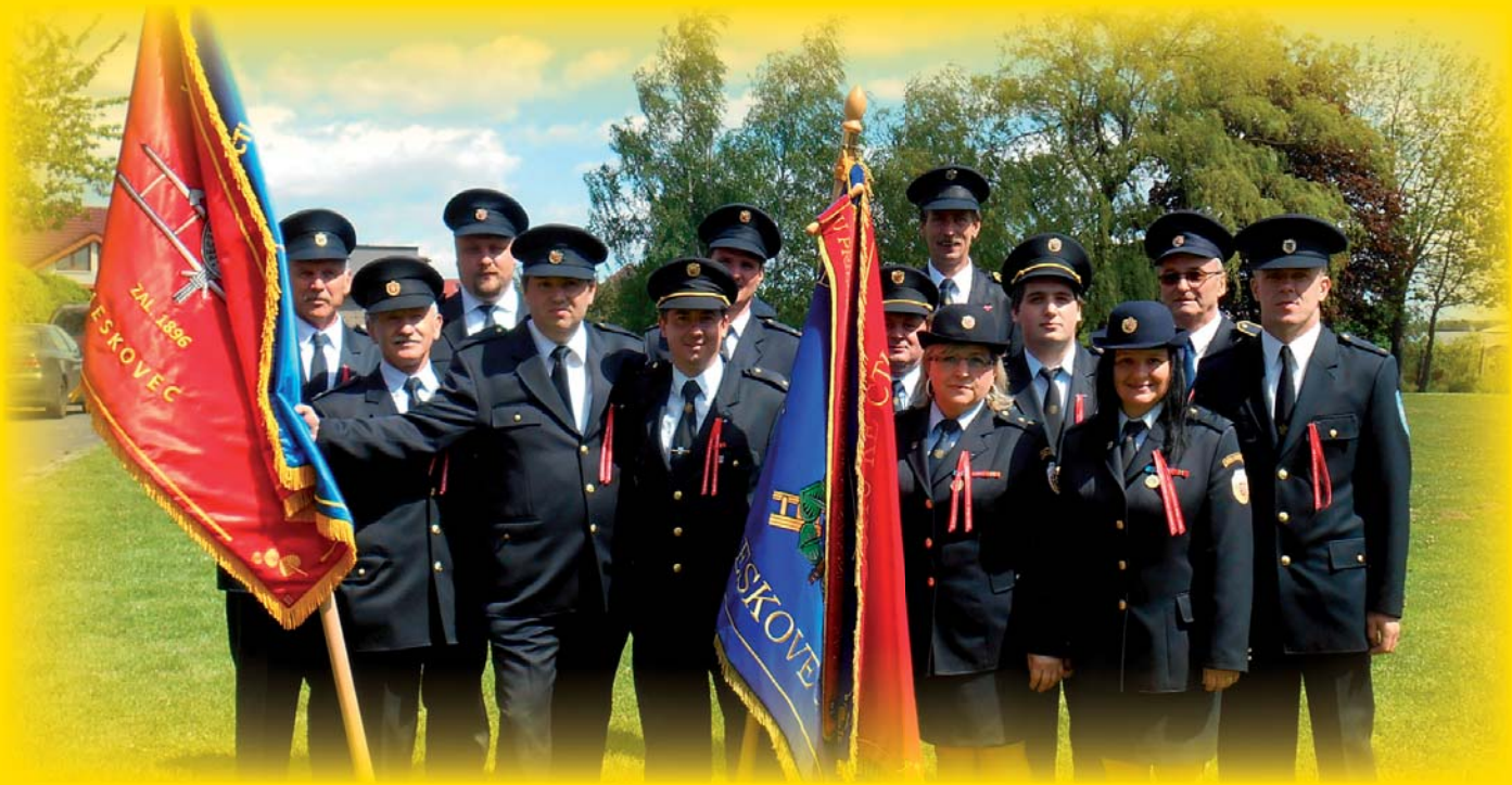
Členové SDH Leskovec u Opavy a SDH Leskovec se slavnostními prapory

Vydává: Obec Leskovec, Leskovec 67, 756 11, IČO 00303984