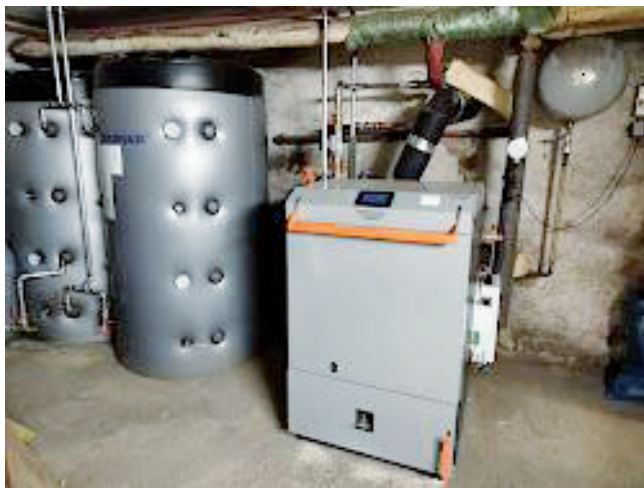
Nový kotel s akumulací nádržemi

K životu sboru patří i péče o budovu a majetek sboru. Letos se nám nejprve podařilo dokončit zateplení půdy farní budovy. Následně byl pořízen nový kotel na dřevo, který splňuje současné normy (viz foto č. 2). Tyto akce by nebylo možné uskutečnit bez štědrých dárců místních i z ústředí církve. Za všechny dary děkujeme.