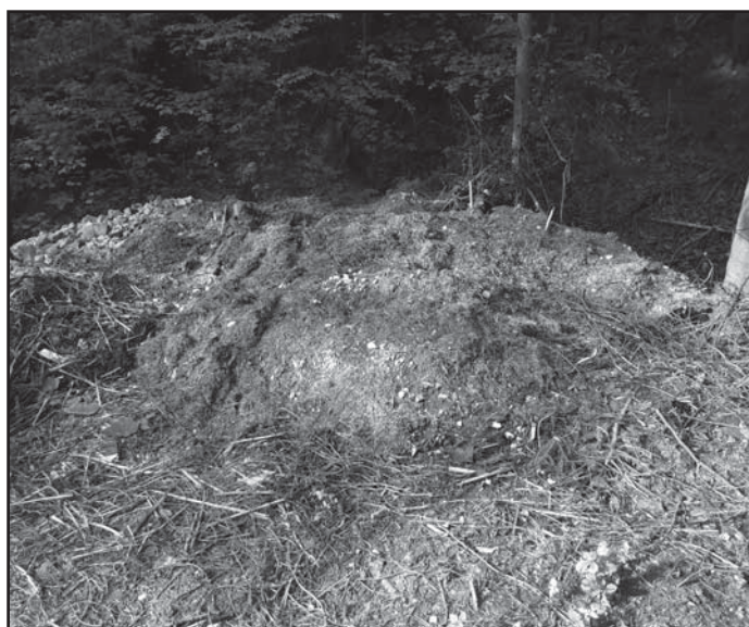
Skládky odpadů na břehu potoka....