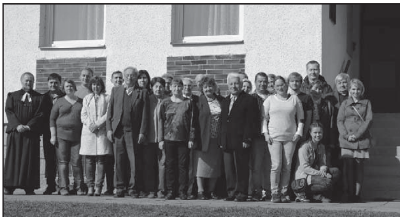
Účastníci bohoslužeb 7.4.2019 před sborovým domem.