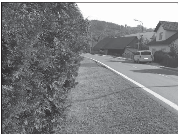
Parkování a poježdění po chodníku znamená nejen ohrožení chodců, když musí vstoupit do vozovky, ale chodníky nikdy nebyly, a ani dnes nejsou budovány, pro zatížení poježděním a parkováním ani osobních vozidel