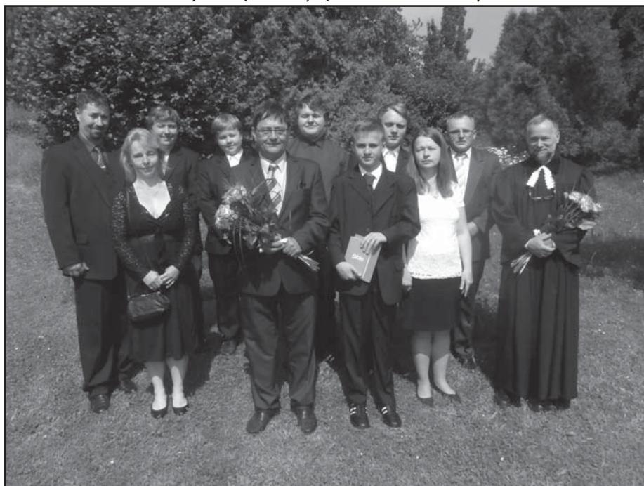
Po konfirmaci - 9.6.2019

Sborové aktivity probíhají i ve všedních dnech. Do května jsme se scházeli ve středu na biblických hodinách. V pátek probíhají pravidelné schůzky dorostu, na škole