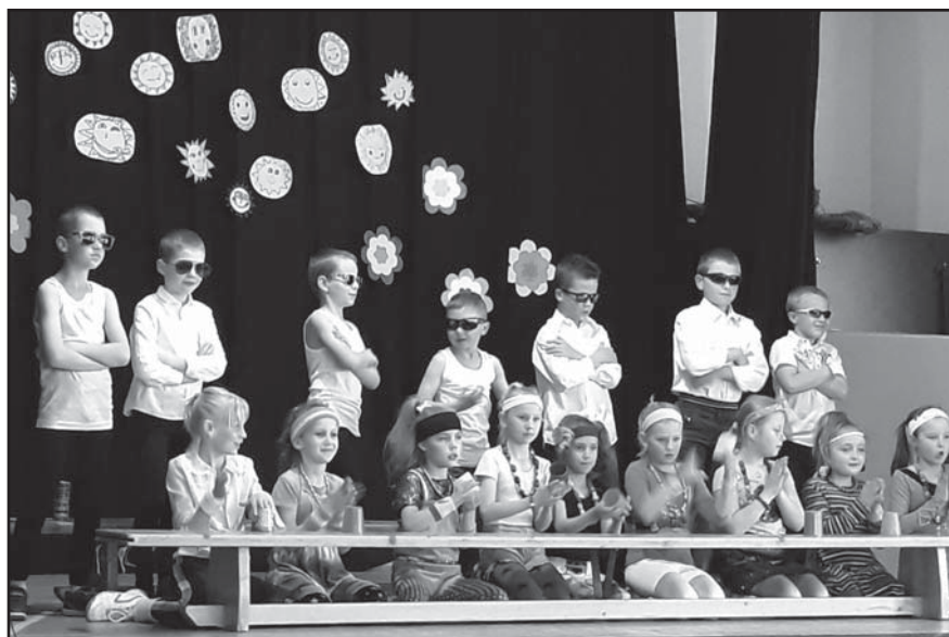
Den matek 12.5.2019

Druhou květnovou neděli jsme pro všechny maminky a babičky přichystali oslavu Dne matek. Děti z místní základní a mateřské školy si pro maminky a babičky