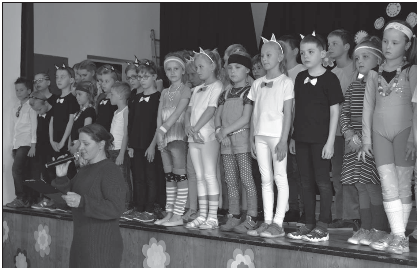
Děti ZŠ a MŠ při vystoupení na Dni matek

V letošním roce jeden z pedagogů dokončil specializační studium v oblasti environmentální výchovy