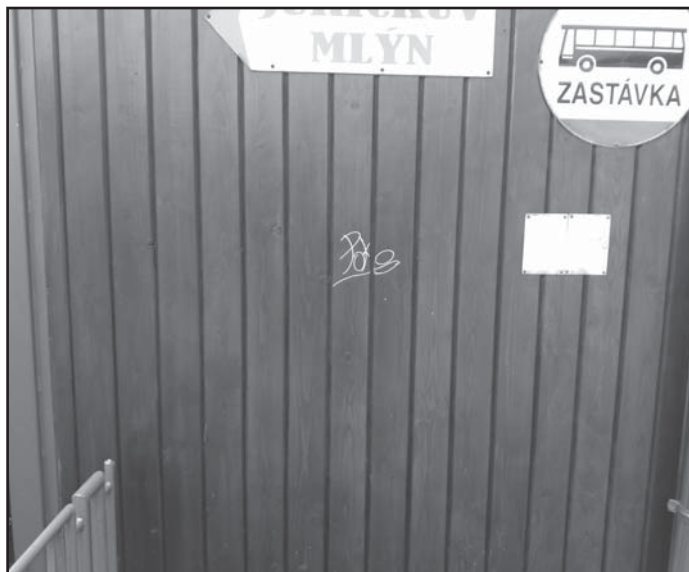
Malování po obecním majetku ???