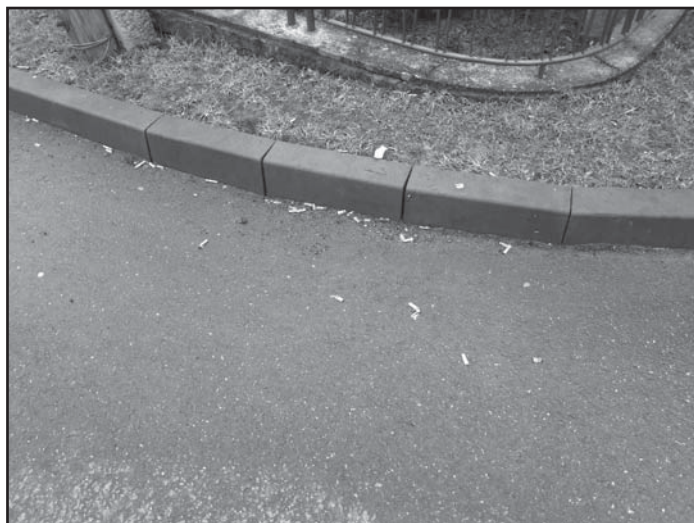
Kuřáci mají popelník dva metry daleko...