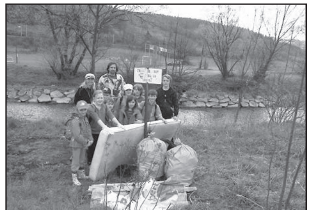
jarní čištění řeky Senice

Rád bych také vzpomněl kreativní dílničky, které organizovaly