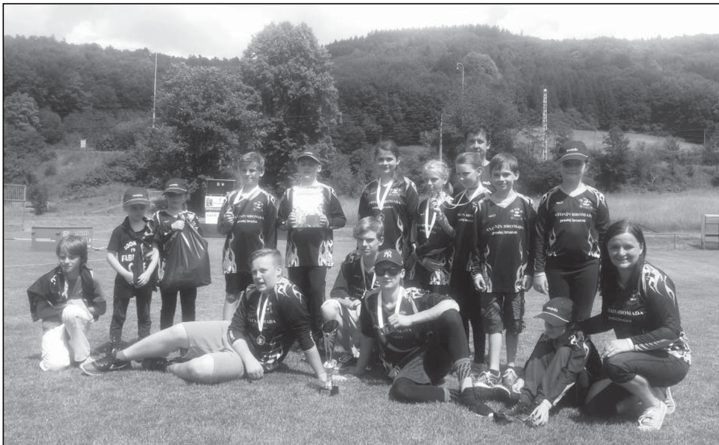
Zisk prvního poháru družstva starších žáků

V květnu se naši členové zúčastnili pravidelné odborné přípravy, která se letos konala v Senince. Letošní odborná příprava byla zajímavá tím, že se konala dálková doprava vody v nočních podmínkách. Nezapomněli jsme ani na naše členky a ke svátku Matek jsme je potěšili malým dárkem. Naše družstvo mužů se zúčastnilo obvodového kola v požárním sportu v Horní Lidči. Soutěžilo se v požárním útoku, v běhu na 100m s překážkami a v pořadové přípravě. Svého obvodového kola se