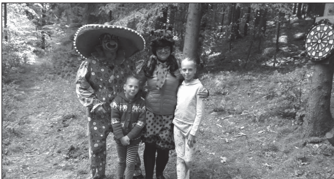
I takové postavičky mohly potkat děti v pohádkovém lese