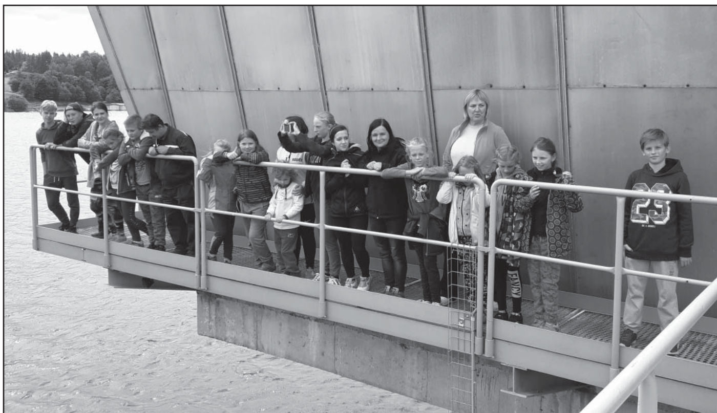
Mladí hasiči při prohlídce přehrady Harta