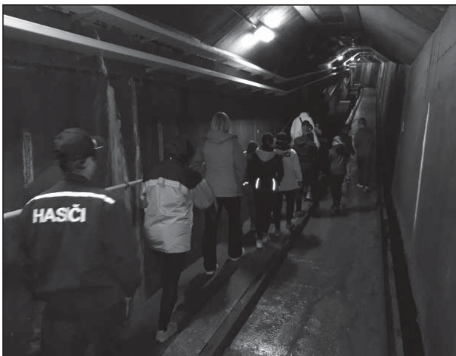
Ve štole pod dnem přehrady