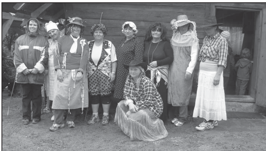
Pohádkové bytosti z pohádkového lesa

V červenci jsme se podíleli na organizaci oslav výročí založení naší obce. Pro děti jsme si připravili pestrý program-soutěže, vystoupení „balónkového“ klauna.