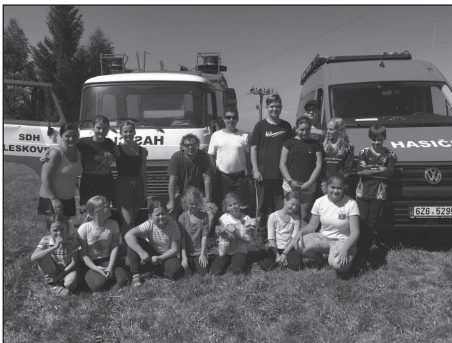
Zastávka na Soláni

Srpnové víkendové stanování, s přípravou na branný závod, vyšlo i se slunečným počasím. Trénovali jsme první pomoc, uzlování, střelbu, topografii, požární ochranu a přeručkování lana na čas. I to je třeba umět ☺. Ko-