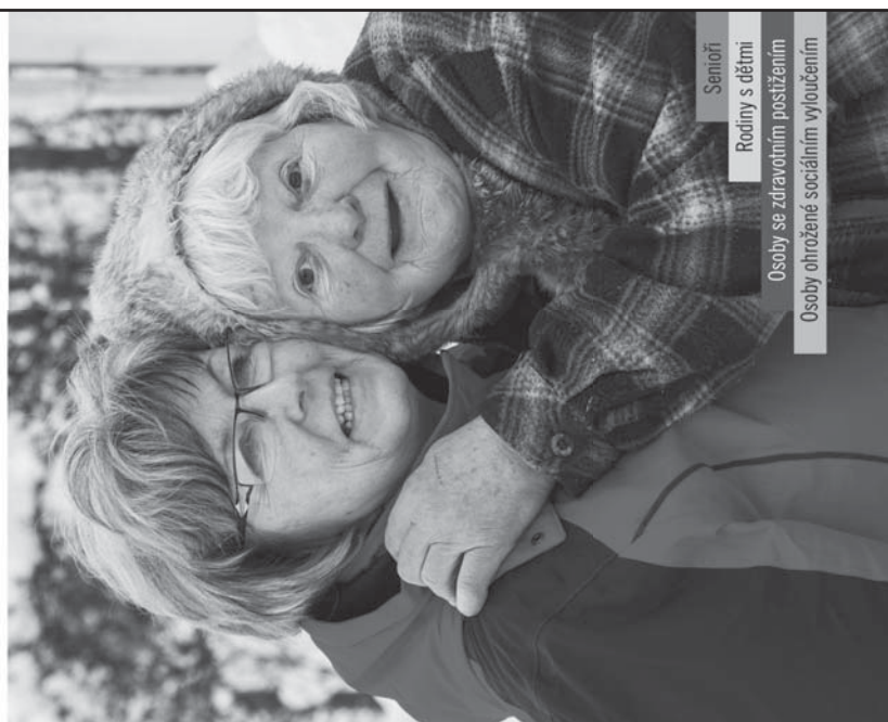
Senioři Rodiny s dětmi Osoby se zdravotním postižením Osoby ohrožené sociálním vyloučením

szaba a tszk: exodus, grafické studio, foto na tiskovinu: Straně Josef Vrážel